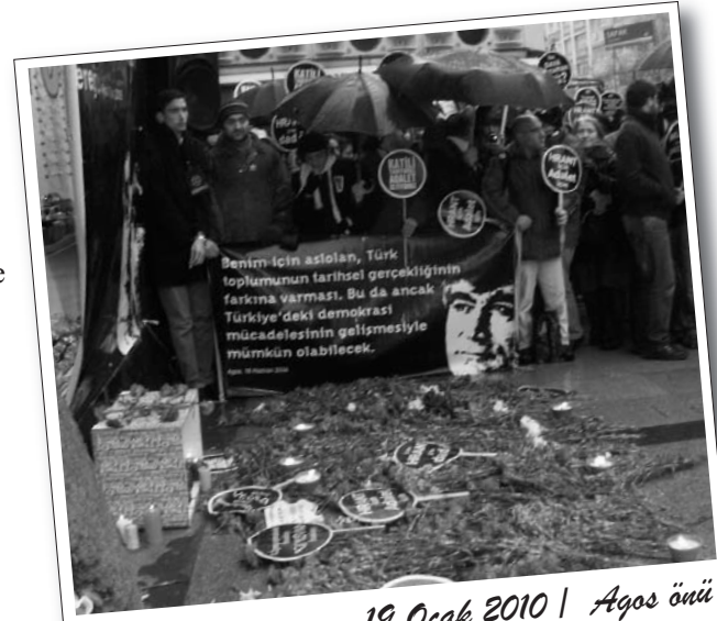
19 Ocak 2010 | Agos ölü

Bir diğer eylem de İHD Ankara Şubesi, ÇHD Ankara Şubesi, Ankara Halkevleri, SES Ankara Şubesi, BDP, EHP, Sosyalist Parti Ankara İl Örgütleri, ESP-G, Ekmek ve Özgürlük, TUM-İGD, Kaldıraç, Aka-DER, DHF, Ankara 78'liler Birlik ve Dayanışma Derneği, Devrimci 78'liler Federasyonu ve TÖP tarafından gerçekleştirildi.