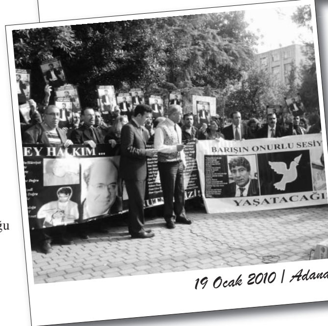
19 Ocak 2010 | Adana

Yüksel Caddesi'nde gerçekleştirilen basın açıklamasında, geçmişte gerçekleştirilen katliamlara da vurgu yapılarak işlenen faili meçhul cinayetlerin aydınlatılmadığı ve karanlığın devam ettiği vurgulandı.